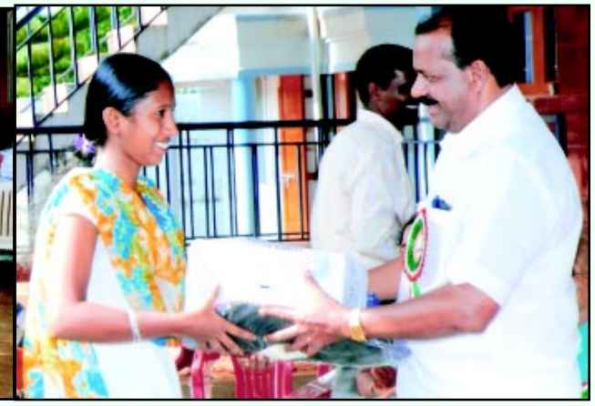
ಸಿಯೋನ್ ಸ್ನೇಹ ಸ್ವ-ಸಹಾಯ ಸಂಘದ ವತಿಯಿಂದ ಸ್ಥಳೀಯ ವಿದ್ಯಾರ್ಥಿಗಳಿಗೆ ಉಚಿತ ಮಸ್ತಕ ವಿತರಣೆ ಸಂದರ್ಭ