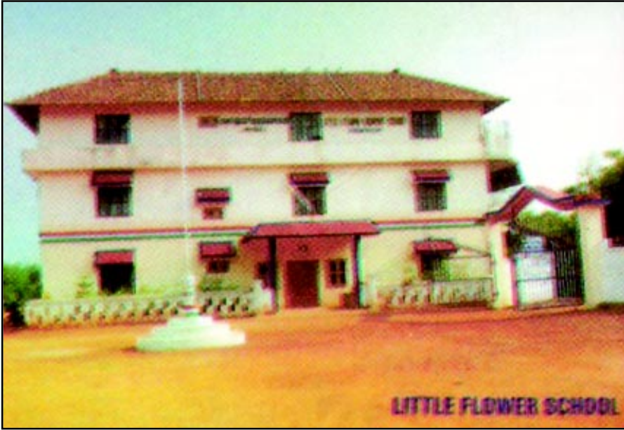
LITTLE FLOWER SCHOOL