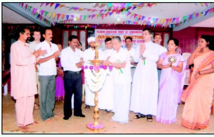
ಹೈಸ್ಕೂಲ್‌ಗೆ ಭದ್ರ ಪಡೆದ ಸಮಾರಂಭ

ರಂಗನ ಪಲ್ಯೆಯಂತಹ ಕುಗ್ರಾಮದಲ್ಲಿ ನಗರದ ಶಾಲೆಗಳಿಗೆ ಯಾವುದರಲ್ಲೂ ಕಮ್ಮಿಯಿಲ್ಲದಂತೆ ಶಿಕ್ಷಣ ಮತ್ತು ಇತರ ಸಾಂಸ್ಕೃತಿಕ ಚಟುವಟಿಕೆಗಳಲ್ಲಿ ನಮ್ಮ ಮಕ್ಕಳು ಹಿಂದಿಲ್ಲವೆನ್ನುವುದನ್ನು ತೋರಿಸಿ ಕೊಡುವುದೇ ನಮ್ಮ ಗುರಿ ಎನ್ನು ಲಿಟ್ಲೆ ಫ್ಲವರ್. ಮುಖ್ಯ ಉಪಾಧ್ಯಾಯಿನಿಯವರ ಛಲಭರಿತ ಮಾತಿನ ಫಲಿತಾಂಶವನ್ನು ಮುಂದಿನ ದಿನಗಳಲ್ಲಿ ನಿರೀಕ್ಷಿಸೋಣ.