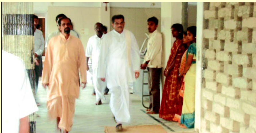
ಮೂಜ್ಯ ಡಾ. ಹೆಗ್ಗಡೆಯವರು ಆಶ್ರಮಕ್ಕೆ ಭೇಟಿಯಿತ್ತಾಗ...

ನಮ್ಮ ಸಿಯೋನ್ ಆಶ್ರಮ ಟ್ರಸ್ಟ್‌ನ ನಿಸ್ವಾರ್ಥ ಸೇವೆಯನ್ನು ಕಣ್ಗಾರ ಕಂಡು ನಮ್ಮ