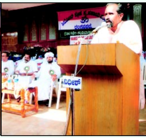
ಸಿಯೋನ್ ಸ್ನೇಹ ಸ್ವ-ಸಹಾಯ ಸಂಘದ ವತಿಯಿಂದ ಸ್ಥಳೀಯ ವಿದ್ಯಾರ್ಥಿಗಳಿಗೆ ಉಚಿತ ಮಸ್ತಕ ವಿತರಣೆ ಸಂದರ್ಭ